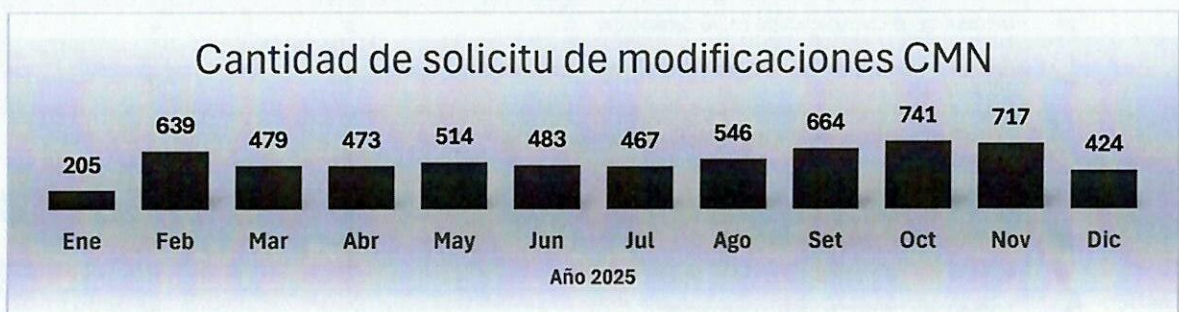
Ilustración 2: Solicitud de modificaciones CMN 2025 - por mes